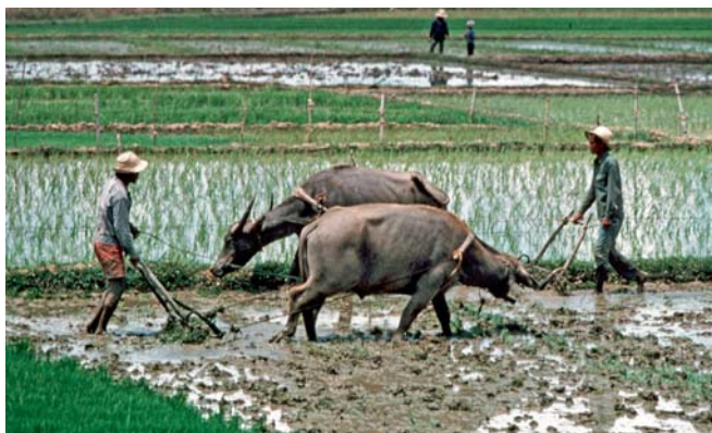
Trabalhadores em campos de arroz