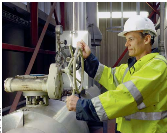
Centro de tratamento de resíduos

damentais de Saúde e Segurança no Trabalho (SST). A aplicação dos sistemas regulatórios da SST não depende da «cor» do emprego. Independentemente do local de trabalho ou do emprego, qualquer que seja a «o verde», os empregadores devem assegurar condições de trabalho e ambientais seguras e saudáveis para os seus trabalhadores. Nesse sentido, as tecnologias e processos dos empregos verdes devem ser objeto de avaliação e gestão de riscos tal como qualquer outro emprego, de preferência nas fases de conceção e pré-operacionais. Estas avaliações são também uma forma eficaz de determinar se uma tecnologia que foi designada de «verde» tem um impacto negativo mínimo, ou até mesmo nenhum impacto, sobre o ambiente.