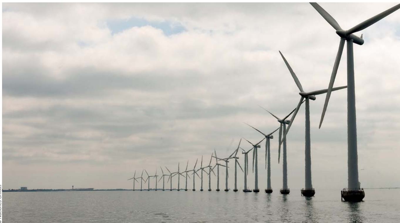
Parque eólico no mar de Middelgruden, Dinamarca