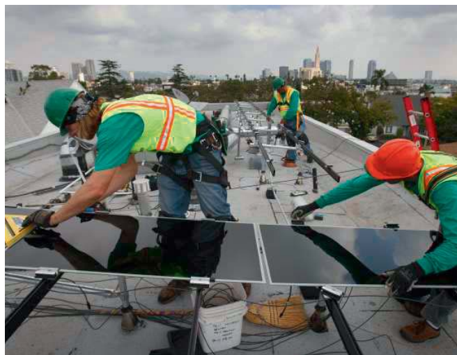
Instalação de painéis solares

Impulsionado por um apoio constante da sociedade, pela expansão dos fluxos de investimento e pelo aumento das capacidades de produção, o emprego na área das energias renováveis tem vindo a registar uma rápida evolução, a qual se espera vir ainda a acelerar nos próximos anos. As energias renováveis criam mais postos de trabalho por unidade de capacidade instalada, potência gerada e dólar investido do que as centrais energéticas assentes nos combustíveis fósseis. Segundo uma estimativa conservadora, cerca de 4,2 milhões de pessoas estão atualmente empregadas mundialmente, no setor das energias renováveis. Metade destes postos de trabalho está ligada aos biocombustíveis, principalmente na área do cultivo e colheita de matérias-primas, mas também à indústria transformadora.