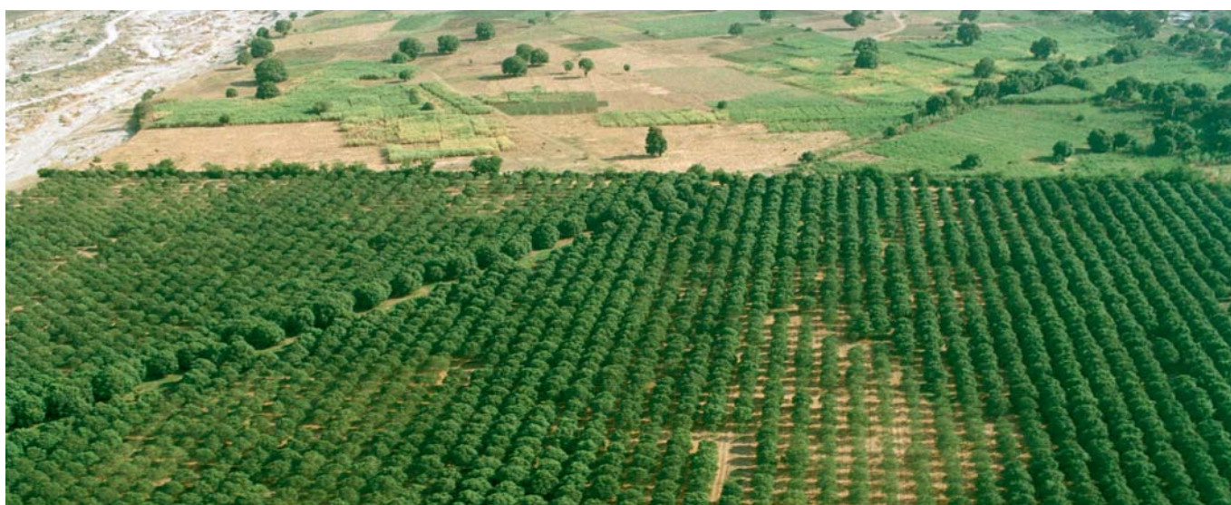
Agricultura no Haiti

Resolução relativa ao contributo da Organização Internacional do Trabalho para a proteção e melhoria do ambiente de trabalho, OIT, 1972.