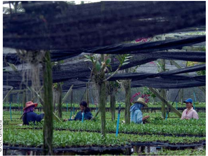
Estufa de orquídeas

potencial para gerar novos empregos verdes são: as energias renováveis, a construção, os transportes, a reciclagem, a silvicultura e a agricultura. Numa primeira fase, o crescimento nestas áreas ocorreu principalmente nas economias industrializadas e em algumas economias emergentes, como o Brasil e a China. No entanto, tem vindo a alargar-se a outros países emergentes e países em desenvolvimento ao longo dos últimos anos 4 .