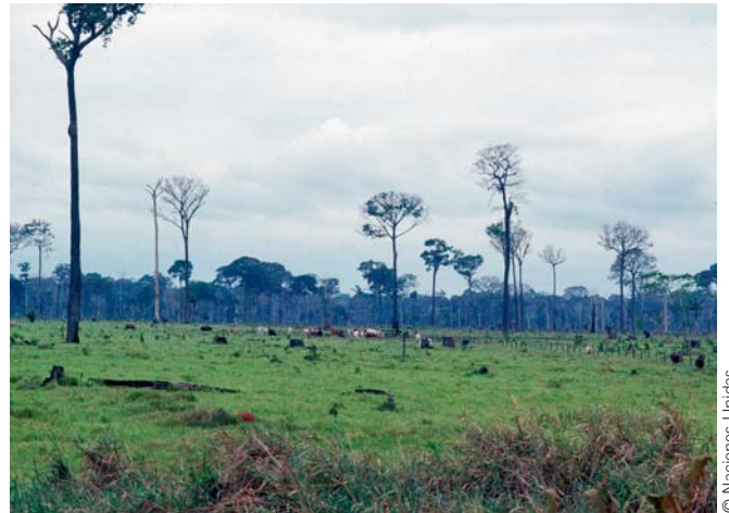
Desflorestação no Brasil

A desflorestação e a degradação das florestas contribuem com cerca de 18 por cento de todas as emissões de gases com efeito de estufa, assumindo-se como as principais responsáveis por comparação com os setores agrícola e dos transportes. Os perigos e riscos profissionais na gestão sustentável das florestas são semelhantes aos dos métodos silvícolas convencionais. Uma diferença chave é o facto de a gestão sustentável assentar em trabalhadores competentes e na sua protecção. O desenvolvimento de empregos verdes neste setor está dependente da inclusão de requisitos do trabalho digno na gestão sustentável da floresta. As normas relativas ao Trabalho Digno, incluindo as recomendações para usar as orientações da OIT sobre SST na silvicultura, assim como as preocupações sociais das comunidades locais, fazem parte das principais normas de certificação florestal para uma floresta sustentável (FSC e PEFC). As mesmas estão agora a ser alargadas a toda a cadeia de valor a jusante na área da indústria da madeira, da pasta de celulose e do papel. No intuito de assegurar os direitos dos trabalhadores, os sindicatos têm insistentemente defendido a inclusão dos princípios das normas internacionais da OIT nos sistemas de certificação.