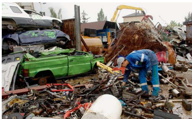
Recolha de sucata