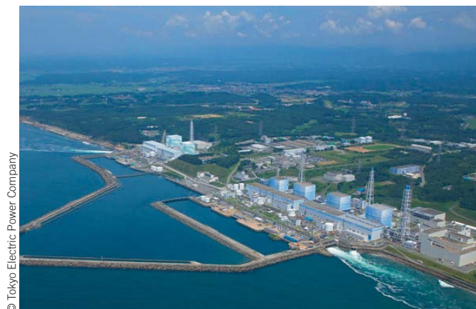
Central nuclear de Fukushima

consequente produção de resíduos nucleares perigosos e de longa duração. Os defensores da energia nuclear salientam sobretudo o seu reduzido impacto global sobre as alterações climáticas. Este tipo de energia praticamente não produz gases com efeito de estufa ou gases ácidos (tais como o dióxido de enxofre e os óxidos de azoto), ao contrário da queima de combustíveis fósseis (tais como o carvão e o gás natural).