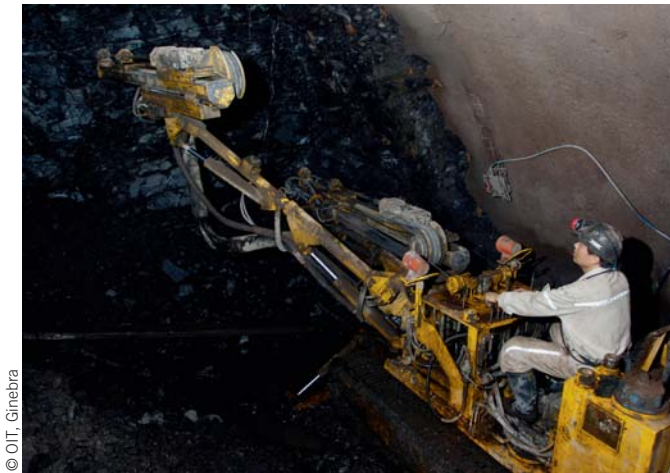
Mina de carvão na China