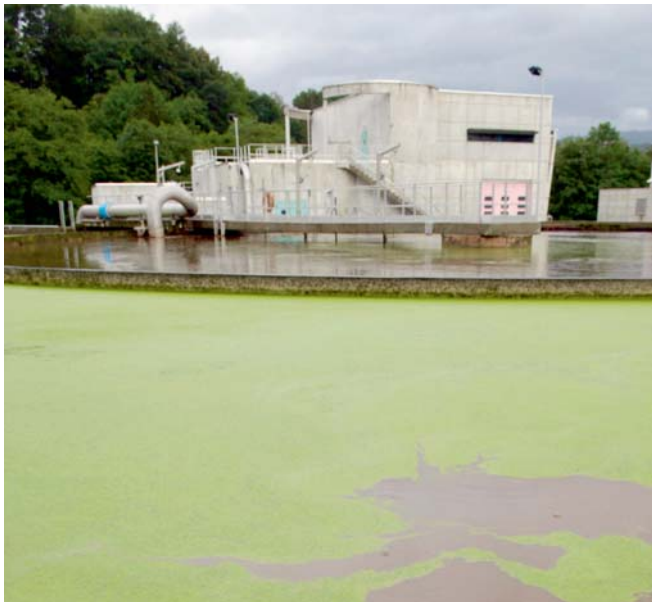
Centro de tratamento de resíduos

A maior parte dos estudos sobre empregos verdes revela que as principais áreas económicas com maior