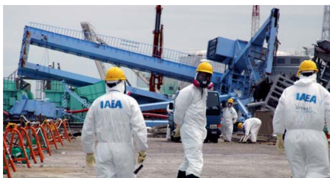
Inspeção de uma central nuclear

São várias as opiniões sobre a possibilidade de a energia nuclear poder vir a integrar, ou não, o pacote energético de uma economia verde. Para muitas pessoas, a energia nuclear não é uma alternativa ambientalmente aceitável aos combustíveis fósseis, tendo em conta as questões que ainda permanecem por resolver nos domínios da segurança, da saúde e do ambiente relativas ao funcionamento das centrais de energia e a